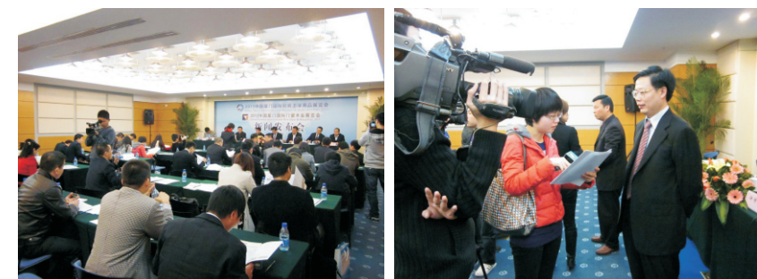
• 2011年2月24日，2011中国厦门国际厨房卫浴用品展览会、2011中国厦门国际门窗木业展览会新闻发布会在厦门国际会展中心举行。

相信在政府的大力支持、媒体的广泛关注和各界人士的共同努力下，2011中国厦门国际厨房卫浴用品展览会、2011中国厦门国际门窗木业展览会将会伴随着厨卫和门窗木业的行业发展给世人交上一份满意的答卷！