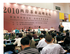
海峡两岸茶文化交流会