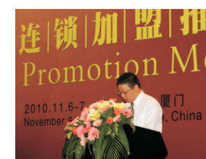
品牌连锁加盟推介会