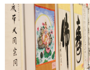
海峡两岸佛门书画展